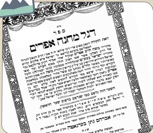
הספר 'דגל מחנה אפרים'