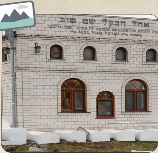
הַמְּבָנָה שֶׁעַל צִיּוֹן הַבַּעַל שֵׁם טוֹב

בְּגִיל 26 הַתְּגַלָּה אֲלָיו אַחִיָּה הַשִּׁילּוּנִי וְלֵאחֶר עֶשֶׂר שָׁנוֹת לַמּוֹד עִם אַחִיָּה הַשִּׁילּוּנִי, נִצְטָוָה מִשְׁמַיִם לְהַתְּגַלוֹת וְכָךְ הָקִים אֶת תְּנוּעַת הַחֲסִידוֹת.